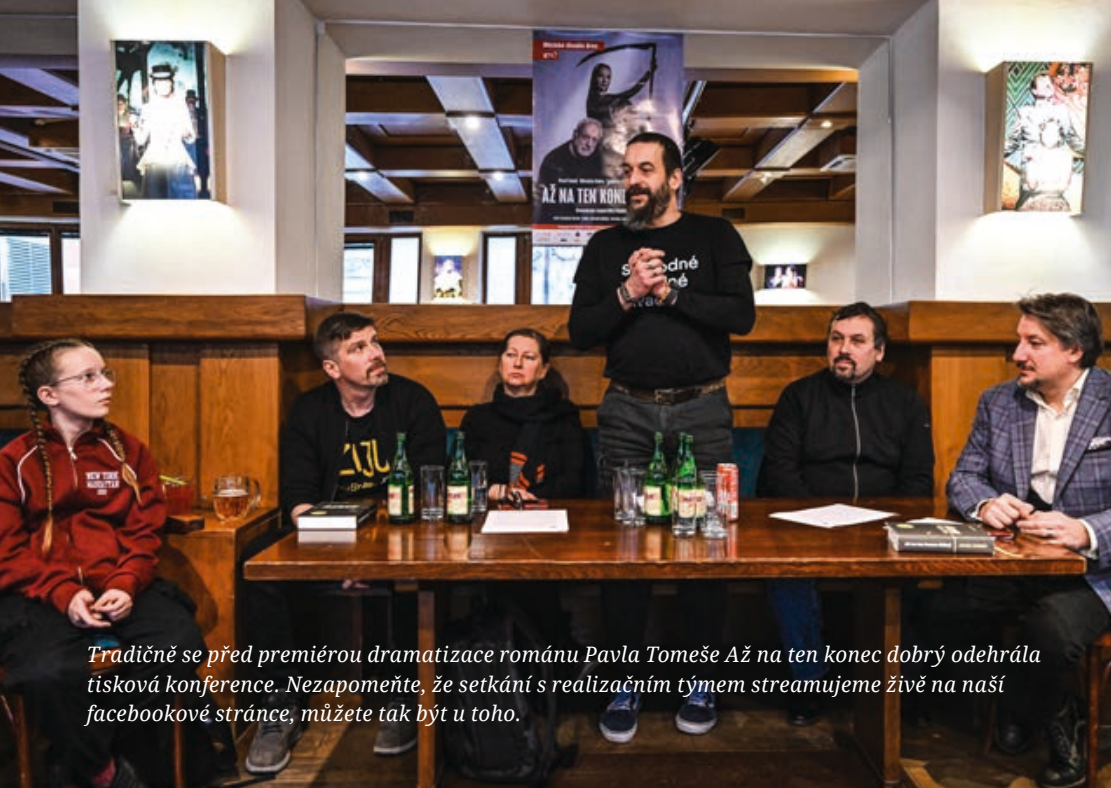
Tradičně se před premiérou dramatisace románu Pavla Tomeše Až na ten konec dobrý odehrála tisková konference. Nezapomeňte, že setkání s realizačním týmem streamujeme živě na naší facebookové stránce, můžete tak být u toho.