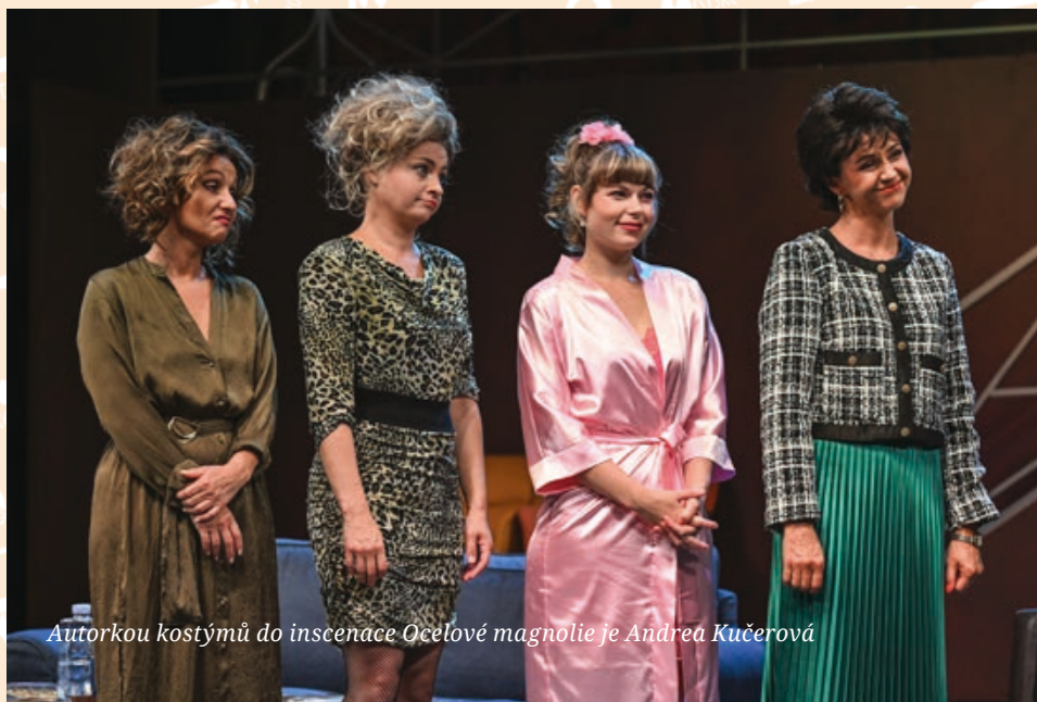
Autorkou kostýmů do inscenace Ocelové magnolie je Andrea Kučerová

Hlasujte v divácké anketě Křídla a oceňte výkony těch, kteří si to podle Vás zaslouží nejvíce! Hlasovat můžete vícekrát, ovšem na stejné jméno a kontaktní údaje může být odevzdáno maximálně 10 hlasů (větší počet nebude při výsledném sčítání započítán), a to pouze prostřednictvím tištěných hlasovacích lístků, které najdete v každém vydání časopisu Dokořán , ve foyer Činoherní a Hudební scény či na pokladnách MdB. Výsledky ankety vyhlásíme v lednu 2026 během slavnostního předávání cen.